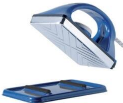
Holmenkol Profil-Wachseisen Smart Waxer 230 Volt