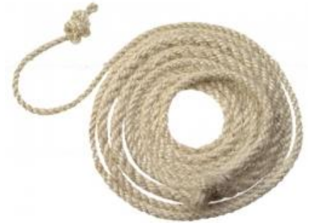
Energetics Springseil Natur