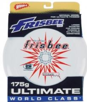
Wham- O Frisbeescheibe Ultimate