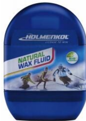
Holmenkol Flüssig-Skiwachs Wax Fluid