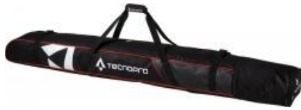
TecnoPro Cover Carving 2 Paar Skisack